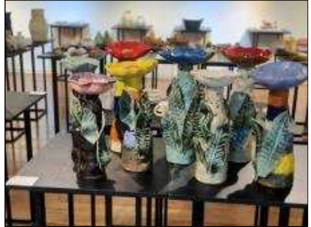
2022제17회 전국장애인도예공모전 대상 - '내 마음의 꽃이 된 너에게'