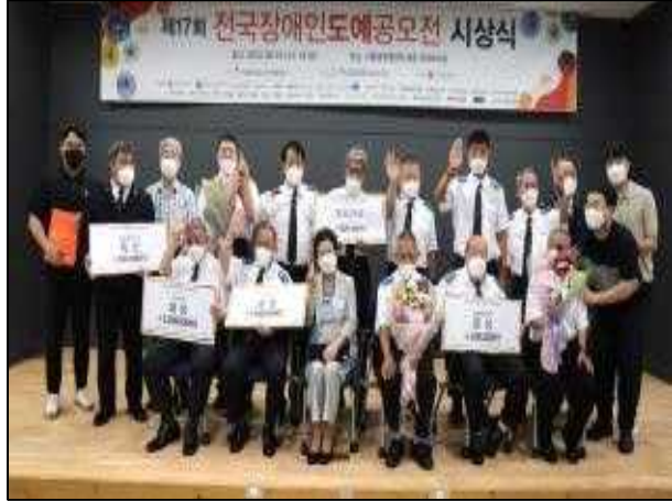
2022년 제17회 전국장애인도예공모전 시상식