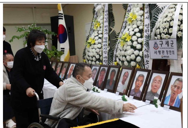
동료 생활인의 추모 현장