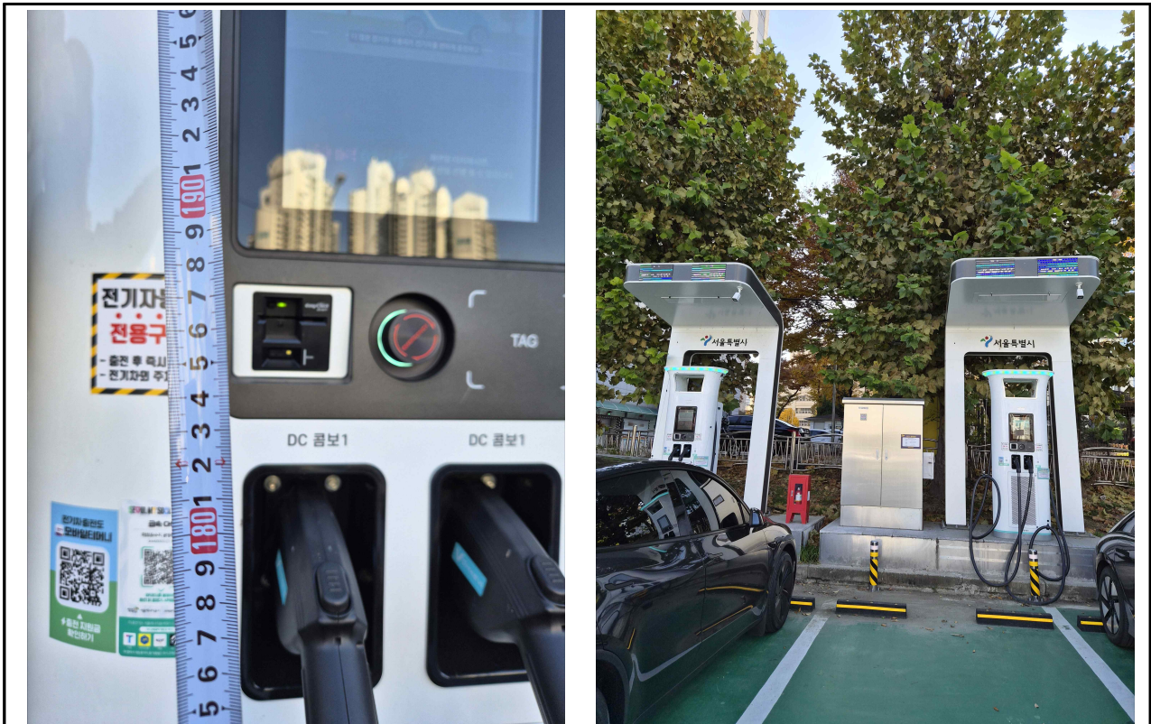
※ 마포유수지공영주차장 내 서울에너지공사 전기차 급속충전기