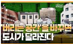
‘버리는 공간’을 바꾸면 도시가 달라진다