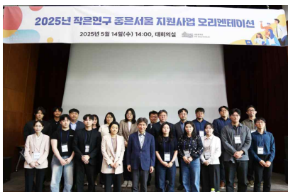
오리엔테이션 및 사업체결(5월)