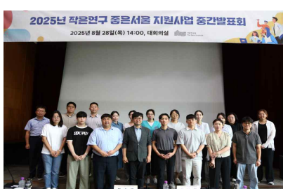
중간 발표 (8월)