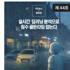
실시간 딥러닝 분석으로 침수 골든타임 잡는다 카드뉴스