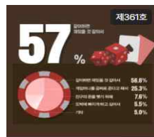
도박, 게임이 아닌 범죄 청소년 도박 실태