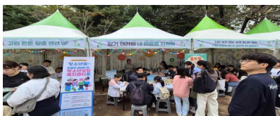
【 청소년 페스티벌 】