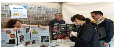
【 성년의 날 】