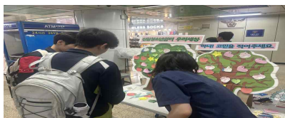
【 연합 아웃리치(신림) 】