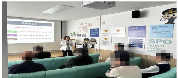
【 관악청소년경찰학교 중독예방교육 】