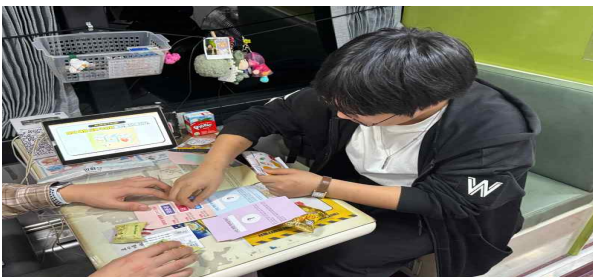
【 이동쉼터(서북) 대면 교육 】