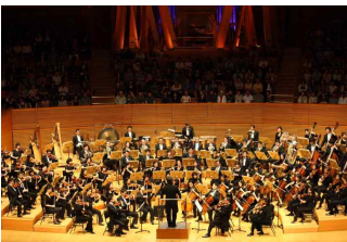
['12년 미국 LA 공연]