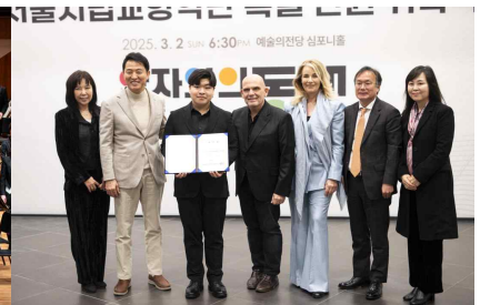
[특별 단위 위촉식]