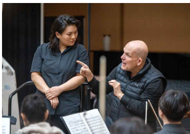
【지휘펠로십 지휘 시연】