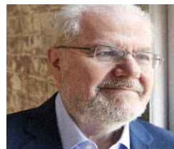
[11월 이매뉴얼 액스(피아노)]