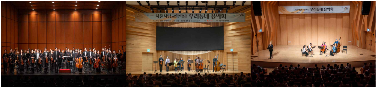
【우리동네 음악회-관현악 및 실내악】