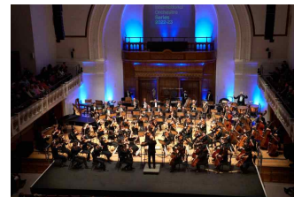
['22년 런던 공연]

○ 중앙아시아 카자흐스탄 방문 공연 ('25년 3월 5일~6일) 완료 130백만원