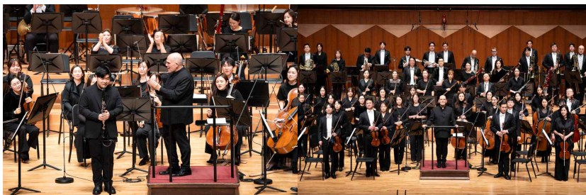
[아주 특별한 콘서트]