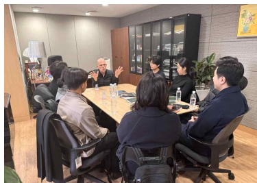
【음악감독 지휘 간담회】