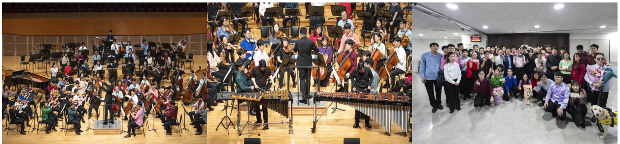
【행복한 음악회, 함께!】