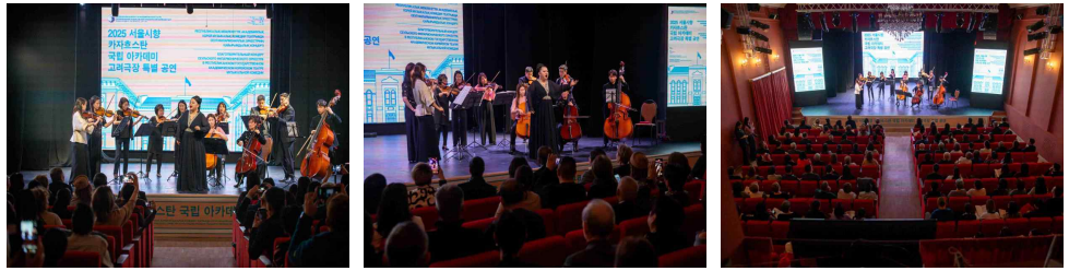
【'25년 카자흐스탄 국립 아카데미 고려극장 특별공연】