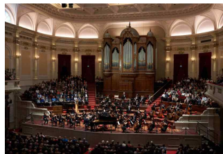
['22년 암스테르담 공연]