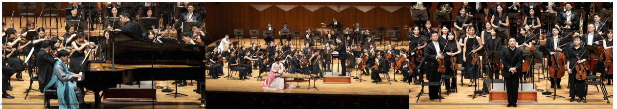
【광복 기념 음악회】