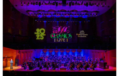
【SM-서울시향 협업 콘서트】