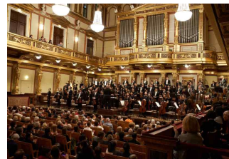
['22년 비엔나 공연]