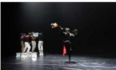
(예술창작지원) 브레스트댄스컴퍼니 <경인>