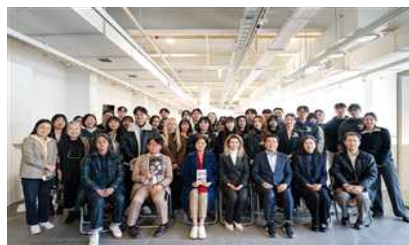
신당창작아케이드 기획전시 오픈닝 전경