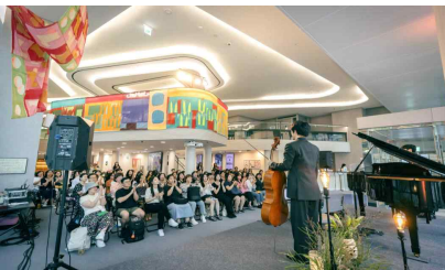
서울문화예술교육센터 용산 클래식 콘서트