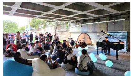
피아노 서울 (서울거리예술축제 연계 이벤트)