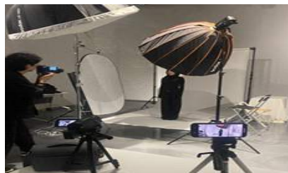
신진 공연예술인 지원 <넥스트 1>