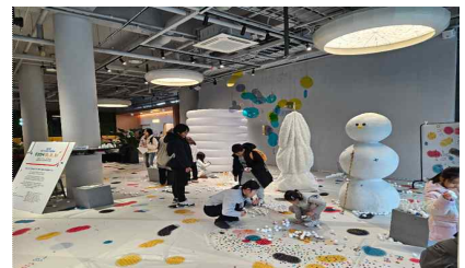
대학로센터 공간 협력사업