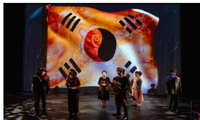
대학로극장 퀴드 광복 80주년 기념 특별프로그램 <열차 37호>