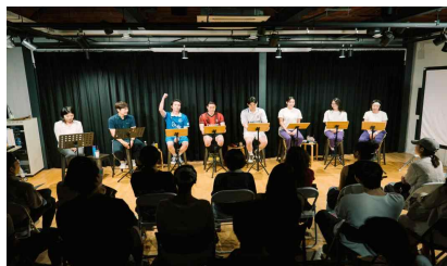
메세나지원사업 선정(극단 바바서커스)