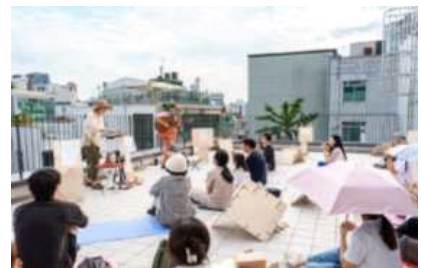
서울연극센터 공간개방 축제 <하기와 보기>