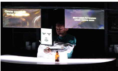
대학로극장 퀴드 해외초청작 <컨선드 아더스(Concerned Others)>