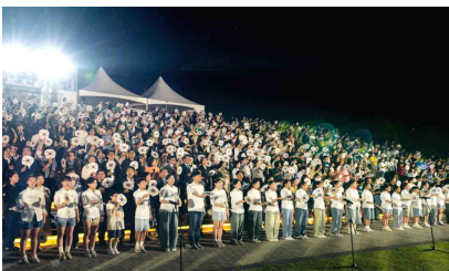
기획공연 (광복 80주년 기념행사)