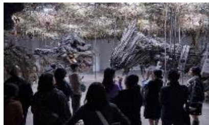
서울시민예술학교 양천 예술마스터 과정