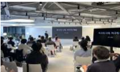
서울예술인 역량강화 <STAND-UP>