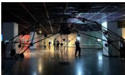
아트센터나비교류 '제30회 ISEA2025'참여