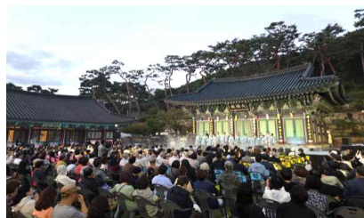
기획공연 (천년고찰 가을음악회)