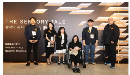
2025년 장애예술창작센터 입주작가 기획전시