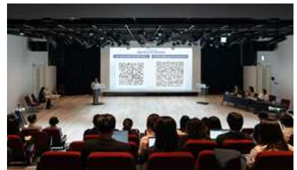
2026년 예술지원 운영안 현장공유회(9.3.)