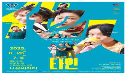
메세나지원사업 선정(극단 58번 국도)

작성자 예술지원본부장 : 백승우 ☎ 3 2 9 0 - 7 0 0 8 예술기반지원팀장 : 황현정 ☎ 3 2 9 0 - 7 1 9 6 담당 : 구슬아 ☎ 7 1 9 7