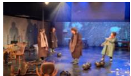
대관운영_‘퍼포먼스온’ 솔취한 사람들