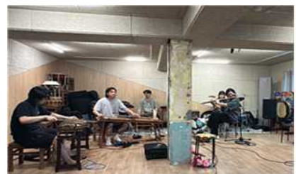
(창작예술공간지원) 악단광칠 연습실