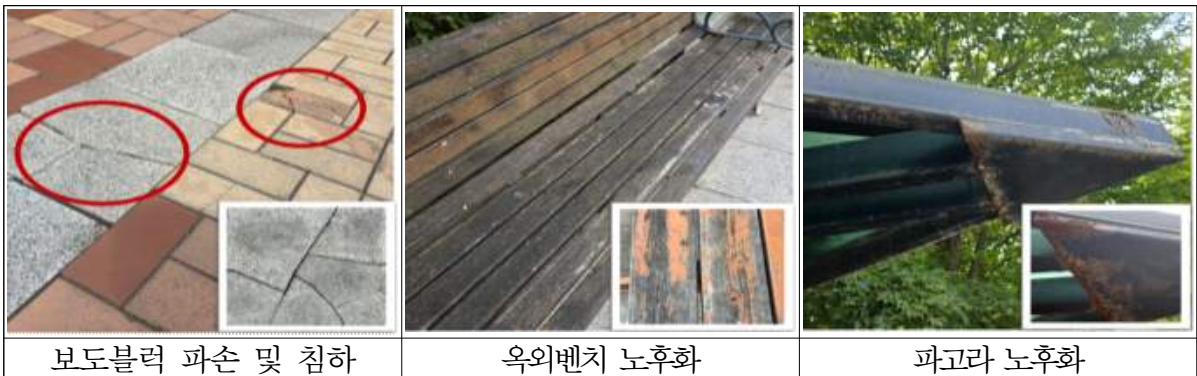
보도블럭 파손 및 침하

→ 병원 설립자에게 의료기관 내부뿐 아니라 외부 환경까지 포함한 안전관리 체계 구축 의무를 명시함